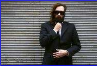
Le musicien Sébastien Tellier, le 26 février 2008 à Paris